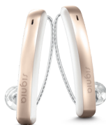
Snow White/ Rose Gold