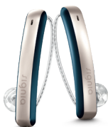
Cosmic Blue/ Silver